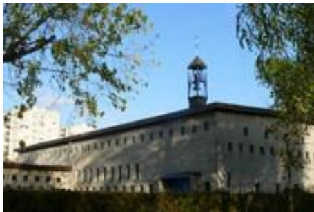
Étoile Sainte Bernadette Paroisse Sainte-Bernadette Secteur pastoral de Savigny/Viry

À une trentaine de kilomètres de Viry-Chatillon, on peut s'y rendre par les départementales : 445, 19, 116, 132 et 27 (via : Fleury-Mérogis - Brétigny-sur-Orge Breuillet - Breux-Jouy - Saint-Chéron)