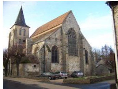
Art religieux et Patrimoine Paroisse du Val-Saint-Germain Secteur pastoral de Dourdan