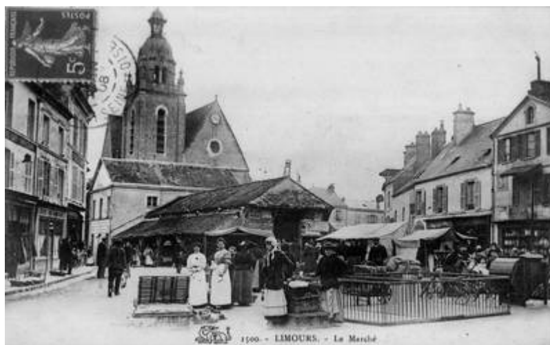
Carte Collection 'La Mémoire de Limours'

À la naissance d'André, Limours est un petit bourg rural, actif, animé, et comprend des fermes, de petites entreprises (transports, garages, charpente, maçonnerie...), des commerçants et des artisans. La commune compte 1400 âmes réparties dans 300 maisons en comptant les hameaux, soit 460 familles. (Cf. 'La Mémoire de Limours')